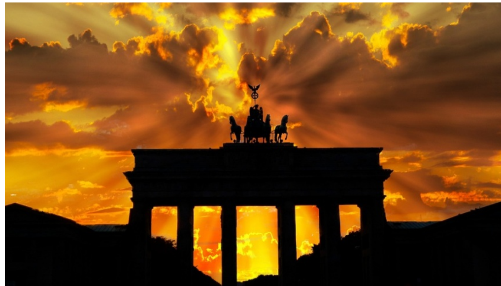
Sonnenuntergang am Brandenburger Tor

Michael Springer 🕒 18. November 2017 📍 Berlin