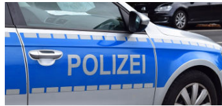
Polizeibericht vom 08.04.2019