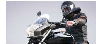
Sicherheitshinweise der Polizei Berlin für Motorradfahrer

Die Tempelhof-Schöneberg Zeitung ist politisch unabhängig und thematisiert Nachrichten aus dem Berliner Bezirk Tempelhof-Schöneberg.