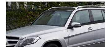
Kraftfahrtbundesamt entdeckt neue Schummel-Software