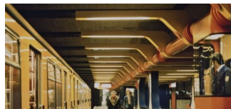
Underground Architecture Berlin