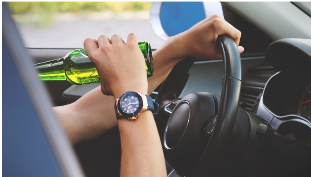
Alkohol am Steuer: Polizei führte Schwerpunktkontrollen in Berlin durch

m/s 🕒 19. Dezember 2017 📁 Polizeimeldungen, Slider