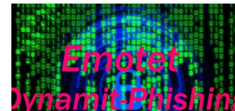
BSI warnt vor gefährlichen Trojanern