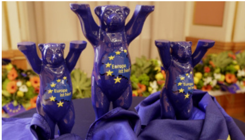
Berliner Europapreis Blauer Bär - Foto: Senatsverwaltung für Kultur und Europa

m/s 9. Februar 2019 Berlin, Europa, Slider