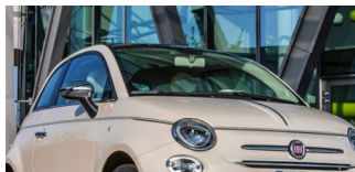
Fiat Cinquecento einfach online leasen?