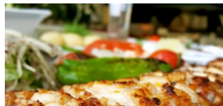
Tempelhof'taki Türk spesiyaliteli