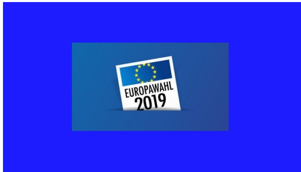
Wahlbezirke zur Europawahl 2019

m/s 🕒 10. März 2019 📁 Bezirk, Europa, Slider 📄 🖨️