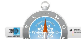
Sicherheitskompass für mehr Internet-Sicherheit