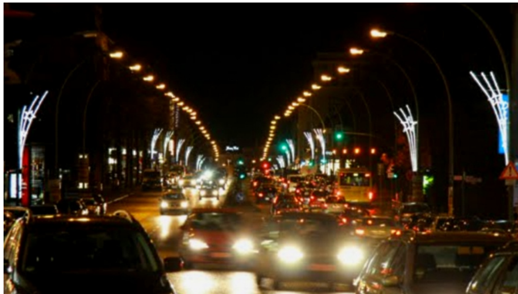
Weihnachtsbeleuchtung am Tempelhofer Damm 2017 - Foto: Archiv tsz