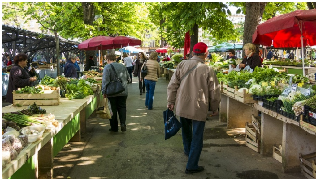
Wochenmärkte bringen Flair und Frische in jeden Kiez

m/s 8. April 2019 Aktuell, Shopping, Slider