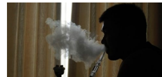
Österreich verbietet Shisha-Bars