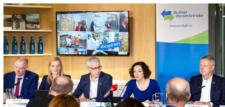
Jahresbilanz 2018 der Berliner Wasserbetriebe