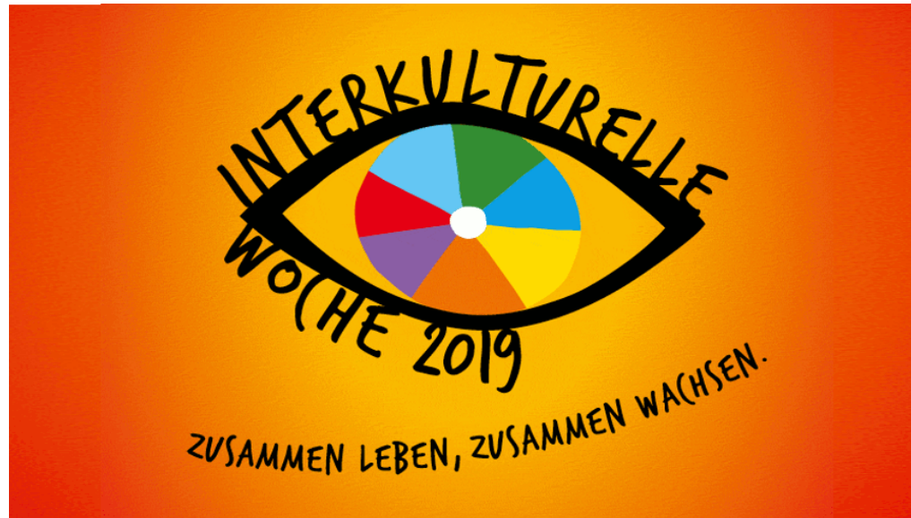
Zwinkerndes Auge - Logo der Interkulturellen Woche

Redaktion 8. September 2019 Berlin, Kultur, Slider