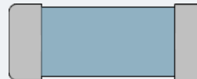
该阻值对应色环图