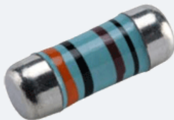
金属膜柱状电阻实物示例图