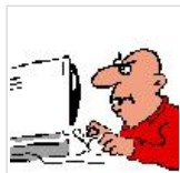
இணையம் படுத்தும் பாடு