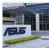
எங்கே தான் தவறு