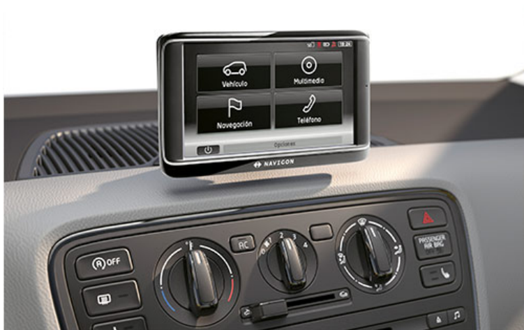
Die abnehmbare Navigationslösung von Navigon

Der Mii wird in drei Ausstattungslinien angeboten. Zum Basisausstattung gehören neben Seitenairbags auch ABS und ein verstellbares Lenkrad. Mit den beiden Ausstattungspaketen Chic und Sport sowie zahlreichen aufpreispflichtigen Optionen lässt sich der Mii nach individuellen Vorlieben gestalten. Chic wird der Mii durch ein Chrompaket, die Sport-Variante wird mit dunkel getönten Scheiben und einer sportlicheren Fahrwerksabstimmung ausgerüstet. Leichtmetallräder und ein Lederlenkrad sind bei beiden Paketen inklusive.