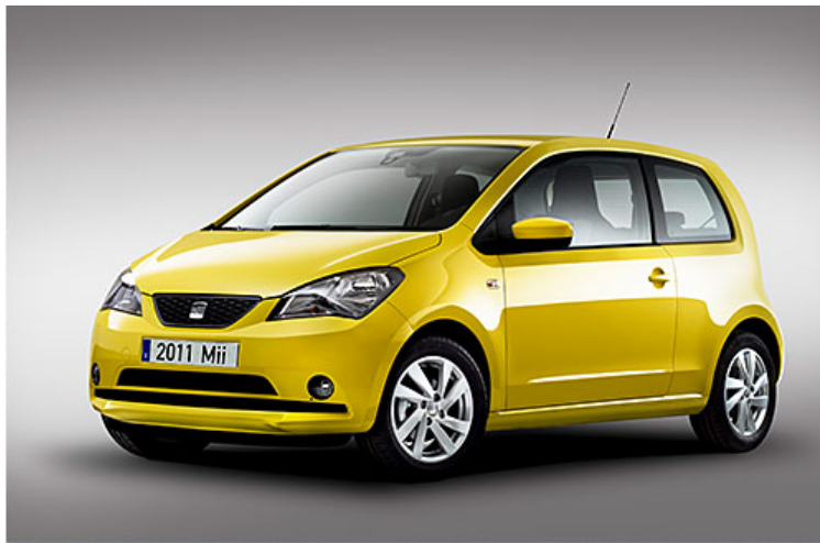
Die Triologie ist komplett: Der zweite Up!-Ieger stammt aus Spanien: Seat Mii