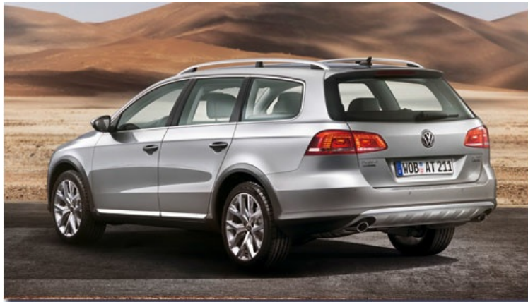
Für die nötige Optik sorgen Stoßfänger im SUV-Stil samt Radhaus- und Schwellerverbreiterungen

Als Zielgruppe peilen die Wolfsburger diejenigen Autofahrer an, die ihren Wagen auch mal gerne als Zugfahrzeug oder im leichten Gelände einsetzen und für sich einen vielseitigen und besonders geräumigen Pkw suchen. Für die nötige Optik sorgen Stoßfänger im SUV-Stil samt Radhaus- und Schwellerverbreiterungen. Geländetaugliche Rampen- und Böschungswinkel und eine erhöhte Bodenfreiheit machen den Passat Alltrack bedingt geländetauglich.