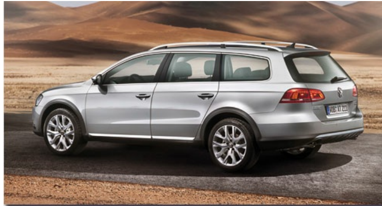
Der VW Passat Alltrack startet im März 2012

Neben den Allroundqualitäten des auf allen Kontinenten angebotenen Bestsellers ist es das große Spektrum der Varianten, das den Passat so erfolgreich macht. Der neue Passat Alltrack wird ausschließlich als Kombi angeboten und schließt die Lücke zwischen dem konventionellen Passat Variant und SUVs wie dem Tiguan.