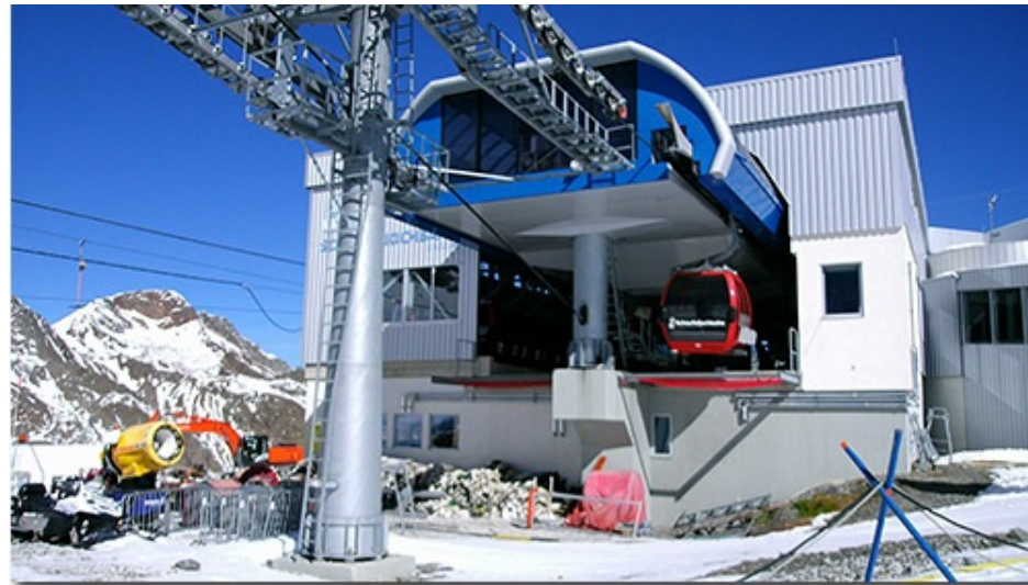
Schweben auf der Gipfelplattform Top of Tyrol auf 3.210 m

Eine Attraktion ist die Gipfelplattform Top of Tyrol am Stubaier Gletscher auf 3.210 Metern Höhe. Die