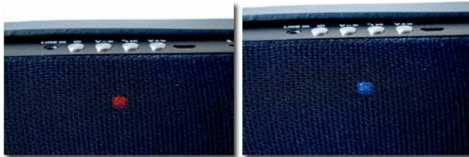
Pairing per Bluetooth sowie Aux-In per 3,5 mm Klinke