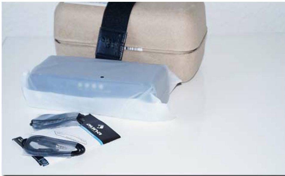
Lieferumfang des Auna Sound Steel