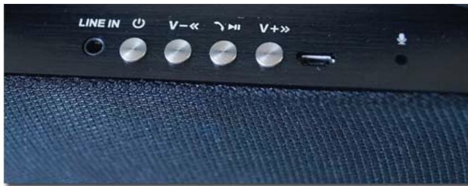
Die Bedientasten auf der Oberseite