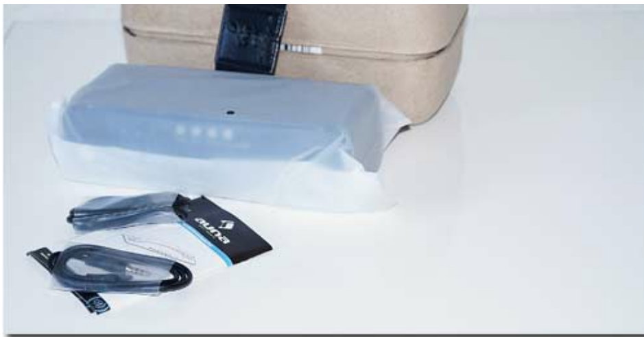
Lieferumfang des Auna Sound Steel