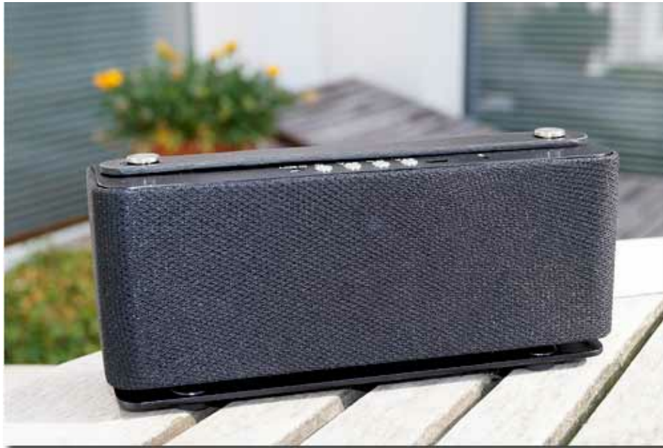
Im Test der mobile Auna Sound Steel Bluetooth-Lautsprecher mit Freisprecheinrichtung und integriertem Akku